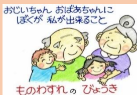
ものわすれのびょうき